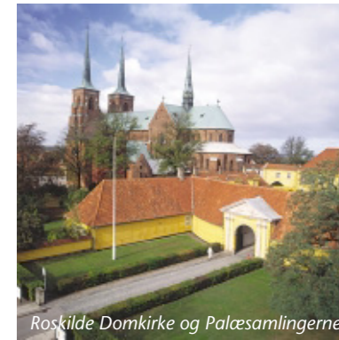
Roskilde Domkirke og Palæsamlingen

derne er der mulighed for at sejle med vikingeskibene og at prøve de gamle maritime håndværk som rebslagning og sejlmageri.