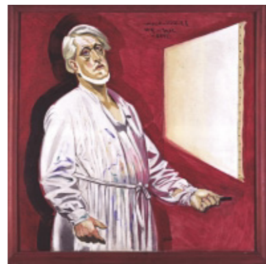
J. F. Willumsens „Selvportræt i malerbluse“ 1933.

Landsbyen Ude Sundby (1) nævnes i skriftlige kilder i 1341. Byen og kirken hørte under Roskilde bispestol. Frederikssund er opstået på Ude Sundbys overdrev som bebyggelse i forbindelse med en handelsplads og udskibningssted for købstaden Slangerup. Først i 1875 fik Frederikssund købstadsrettigheder. Dæmningen og broppen „Tandstumpen“ (2) syd for havnen stammer fra en jernbanebro, der førte jernbanen fra Frederikssund over Hornsherred til Hvalsø, Ringsted og Næstved. Banen åbnede i 1928, men blev allerede nedlagt i 1936. Frederikssund har de seneste årtier gennemgået en omfattende fornyelse, hvor især den moderne arkitektur omkring den gamle industrihavn, har gjort byen kendt langt ud over landets grænser.