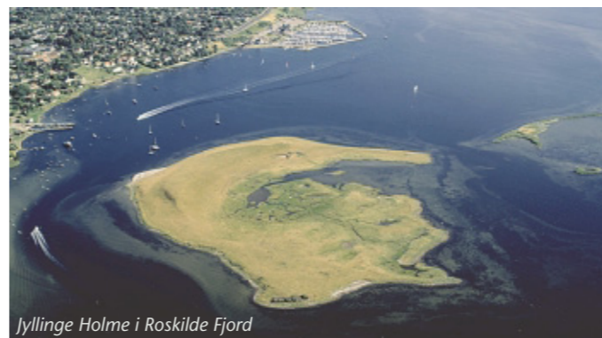
Jyllinge Holme i Roskilde Fjord

Fra Nordmarksvej ses de ubeboede øer, Jyllinge Holme (14). Fjorden, øerne og strandengene er velegnede og beskyttede ynglesteder for en række fuglearter som vadefugle, terner, måger og svaner. Området er udpeget som EF-fuglebeskyttel-