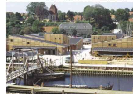
Aktiviteter på Vikingeskibsmuseet